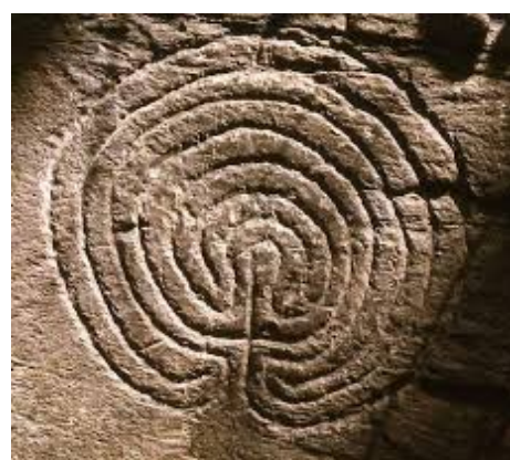
Tintagel, Cornouailles. Labyrinthe : à la recherche d'ordre, d'orientation et de signification

Chacun de nous est un minuscule maillon, une étape du processus de la vie qui nous précède et nous suit, commencé depuis des temps immémoriaux. Nous faisons partie de ce tout dont nous sommes issus, mais en naissant dans ce monde, nous en perdons la mémoire et nous nous percevons comme des moi séparés. Cependant, en nous, au-delà de cet « oubli ontologique », se trouve la mémoire de tout l'univers. Bien que cette mémoire ne soit pas ordinairement accessible, les hommes ont, depuis des temps immémoriaux, exploré l'intériorité de la psyché pour connaître et guérir. Les chamans explorent des états de conscience non ordinaires. Les mystiques de différentes latitudes, comme le décrit Aldous Huxley dans sa Perennial Philosophy , ont décrit l'unité du tout. L'arbre de la vie, Axis Mundi, est un archétype présent dans de nombreuses cultures ancestrales qui représente cette unité et cette conscience : passer de l'inconscience profane à la conscience ontologique, du labyrinthe, du chaos, à la recherche du sens de la vie et à l'ordre du sacré.