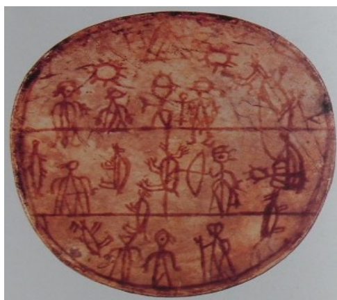
Les trois mondes représentés sur un tambour chamanique Sami, XIXe siècle

Cet écrit est une première leçon théorique, mais il peut être développé au niveau de l'expérience chamanique.