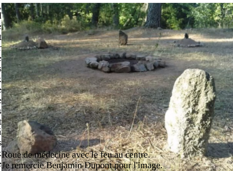
Roue de médecine avec le feu au centre. Je remercie Benjamin Dupont pour l'image.

Au centre se trouve notre cœur, manifestation intérieure du Grand Esprit, qui coïncide avec le feu sacré que les Cherokees appellent Ishkudé. Le feu et le cœur coïncident, ils sont la septième direction à laquelle sont liés les archétypes, qui correspondent aux points cardinaux. La roue de médecine n'est pas seulement une cartographie, elle comporte plusieurs niveaux de représentation : en tant qu'espace sacré, c'est un temple qui représente le cosmos, les points cardinaux correspondent aux moments de la journée à travers le lever et le coucher du soleil, les